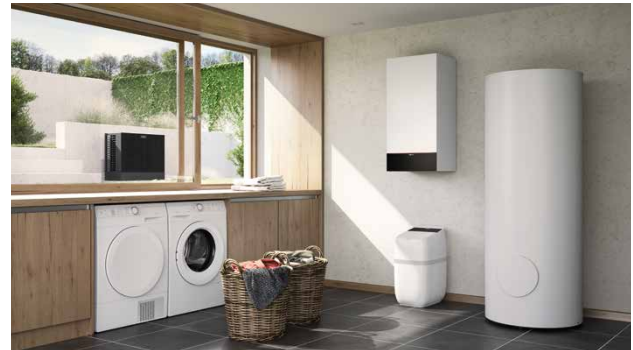
Luft/Wasser-Wärmepumpen Vitocal 200-S mit untergestellter Trinkwasser-Enthärtungsanlage Vitaset Aqua

* Optionales Zubehör ist kein Bestandteil des SVGW-Zertifikats der Vitaset Aqua CH